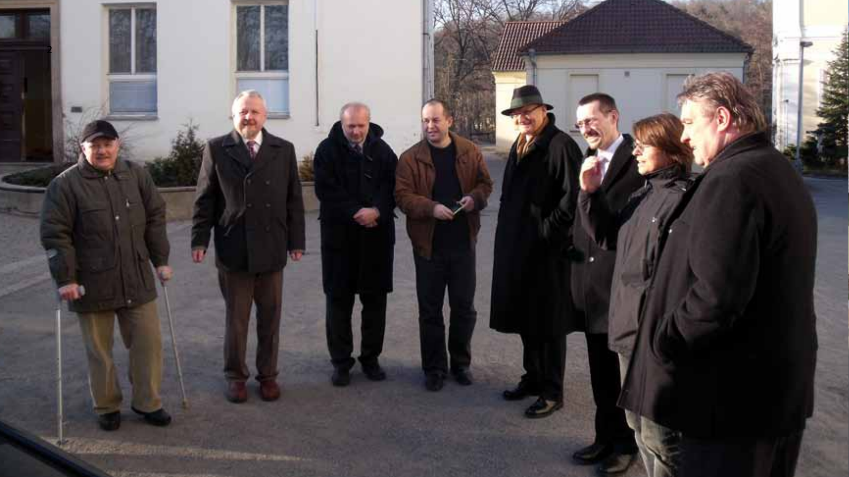
▲ Zástupce Města Úvaly, ROP Střední Čechy, A-LT Architekti v.o.s. a generálního dodavatele OHL ŽS .a.s. při slavnostním zahájení projektu.