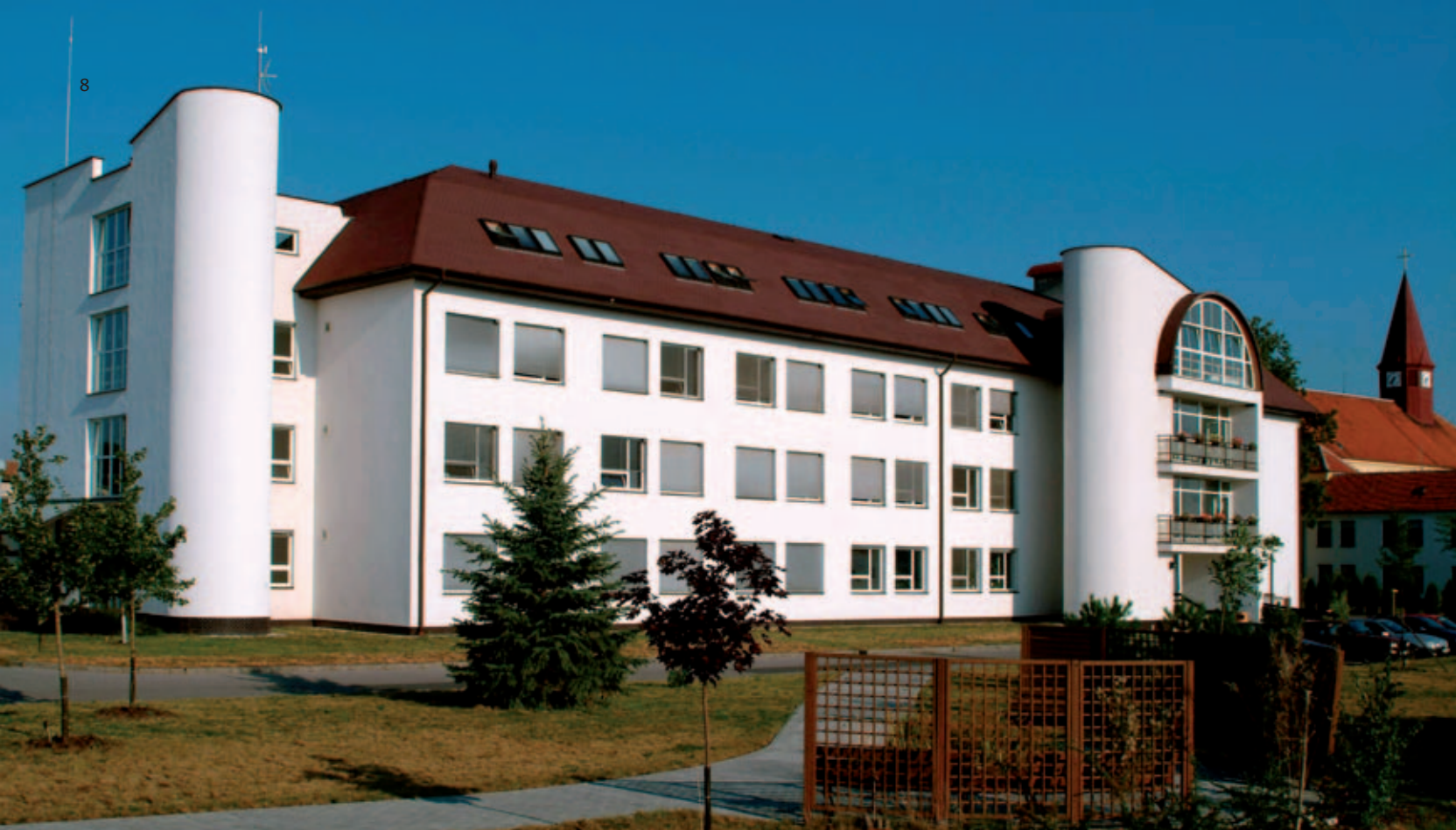
Dům léčby bolesti s hospicem sv. Josefa v Rajhradě u Brna